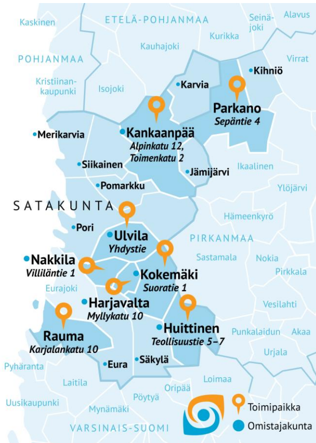
Kuvio 1. Satakunnan koulutuskuntayhtymän jäsenkunnat v. 2025

Alueellisesti kuntayhtymä sijoittui Satakunnan seutukuntiin kuvan osoittamalla tavalla. Kuntayhtymä sijoittuu maakunnallisesti kaikkiin kolmeen Satakunnan seutukuntaan ja Kihniön kunnan osalta Pirkanmaan maakuntaan. Lisäksi kuntayhtymä järjestää koulutusta toimipisteissään Parkanossa ja Raumalla.